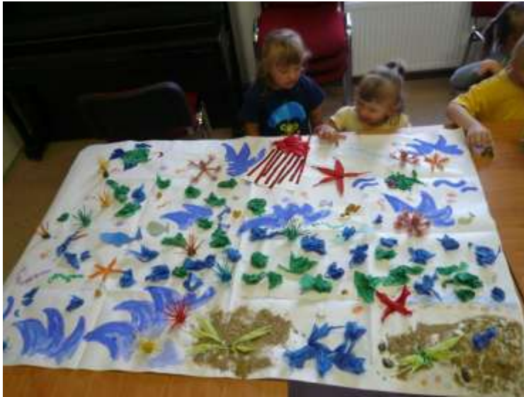
výtvarné tvoření v Březejci - „moře“